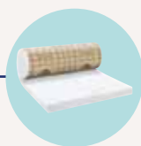
PURE 32 QP