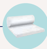
PURE 35 QN