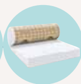
PURE 40 RP