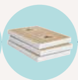
PURE 32 PP