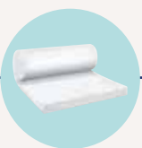
PURE 35 QN