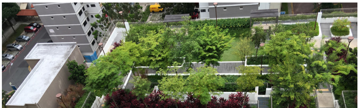
3 Bloque de apartamentos (Singapur)