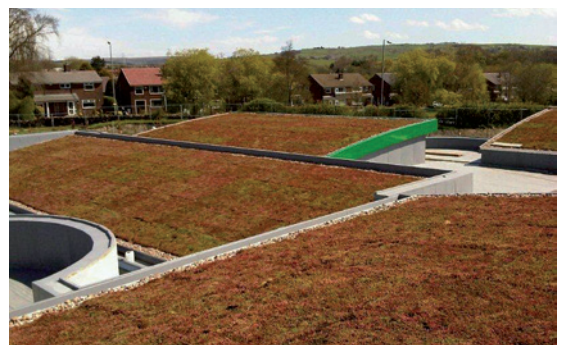
2 Escuela (Inglaterra)