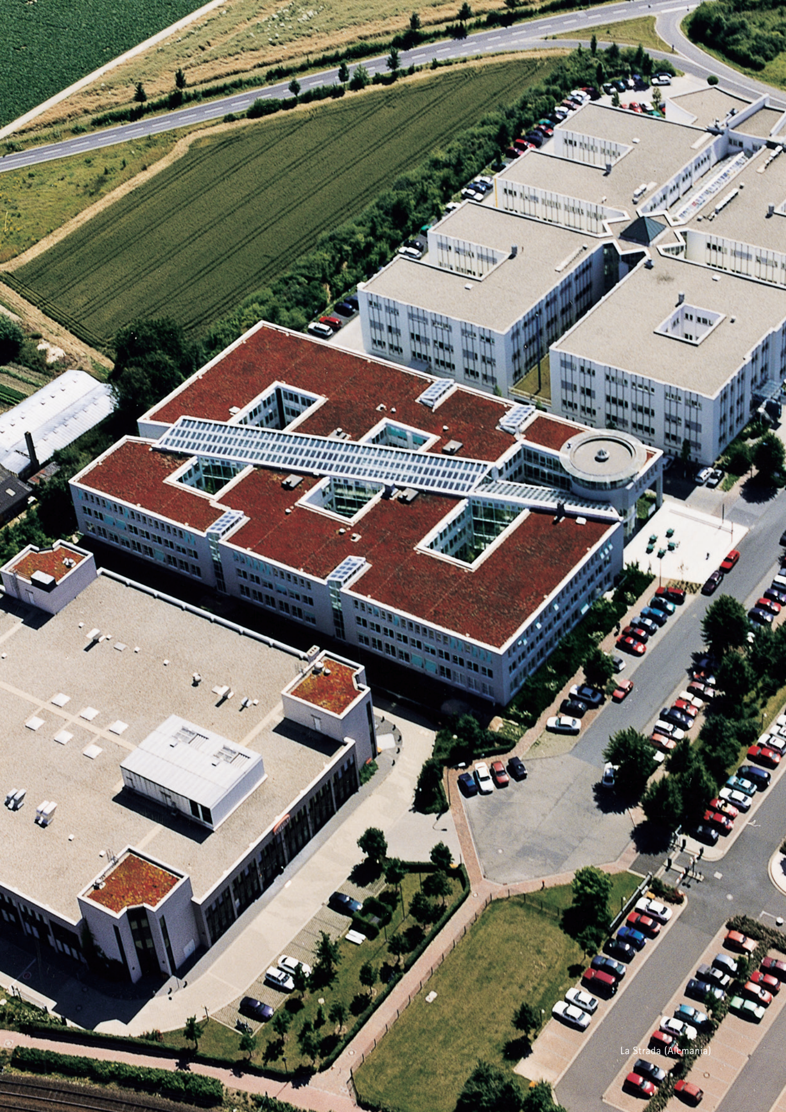
La Strada (Alemania)