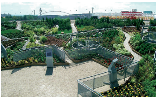
Plaza temática (España)

*Para cubiertas con una inclinación más grande, es importante contactar con los servicios técnicos de RENOLIT Ibérica.