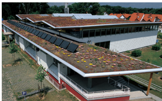
1 Centro Deportivo (Alemania)

*Algunas plantas como el bambú deben evitarse debido a la agresividad de sus raíces. Para obtener una lista completa de plantas prohibidas en el marco de cubiertas ajardinadas: Cf: « Krupka, Bernd. Dachbegrünung – Pflanzen und Vegetationsanwendung an Bauwerken ». Stuttgart, Ulmer. 2000)