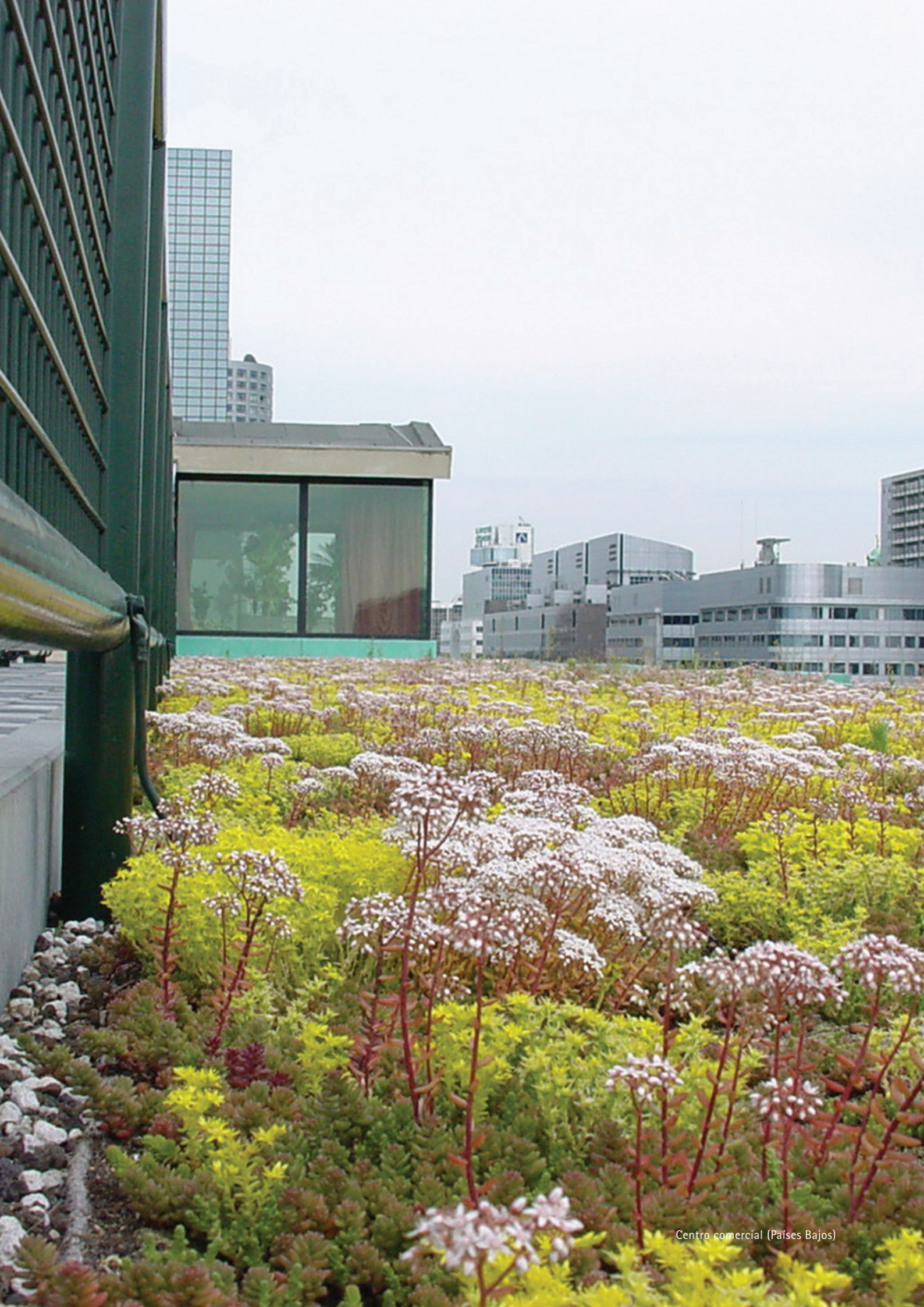
Centro comercial (Países Bajos)