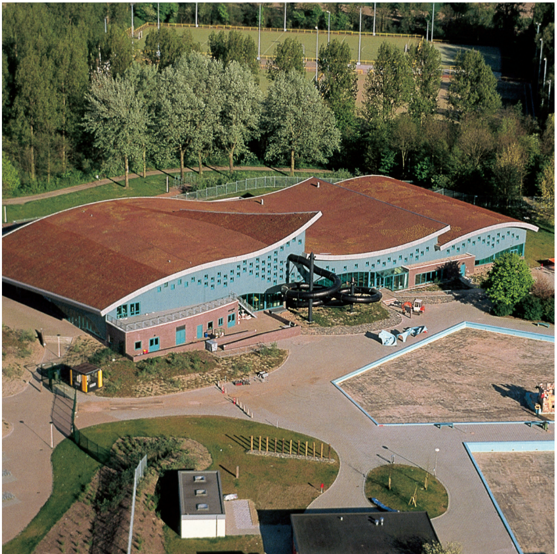
Piscina 'Het Keerpunt' (Países Bajos)

El sistema RENOLIT ALKORGREEN ofrece a nuestros clientes un sistema de cubierta ecológica optimizada y totalmente adaptada a nuestra membrana RENOLIT ALKORPLAN.